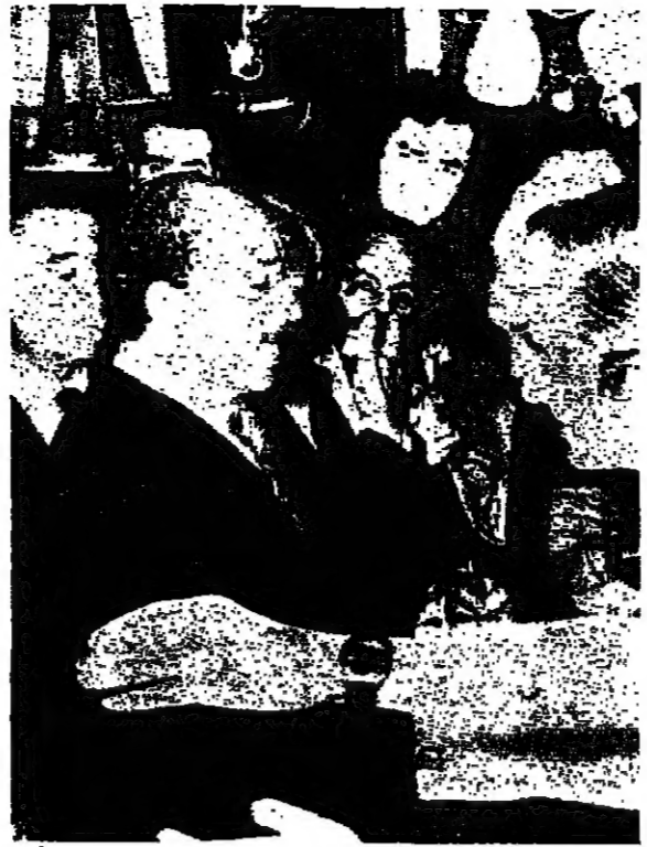
الرئيس المصري أثناء زيارته مصانع تومسون أمس